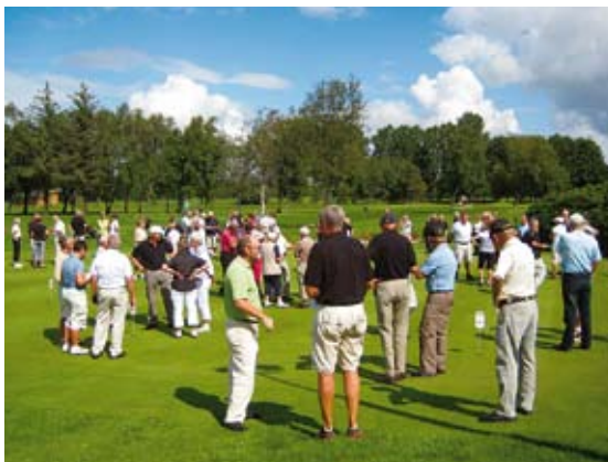
Velkomst og matchinformation fra FLR's gensynsmatch på Herning Golfklubs Parkbane, 15. august 2008. 100 golfere deltog fra 22 forskellige golfklubber i Danmark, som har været deltagere i FLR's matchture i 2007 og/eller 2008.