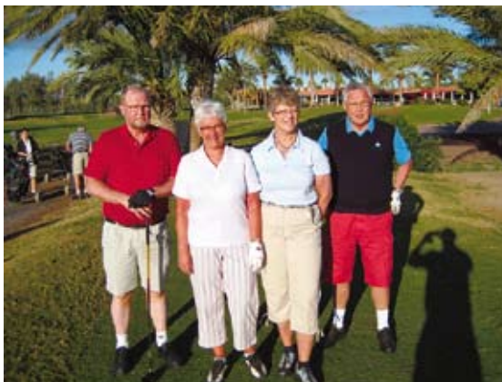
En typisk 4-bald fra vor matchtur sidste vinter til Gran Canaria. Billedet er fra 1. tee på Maspalomas banen.